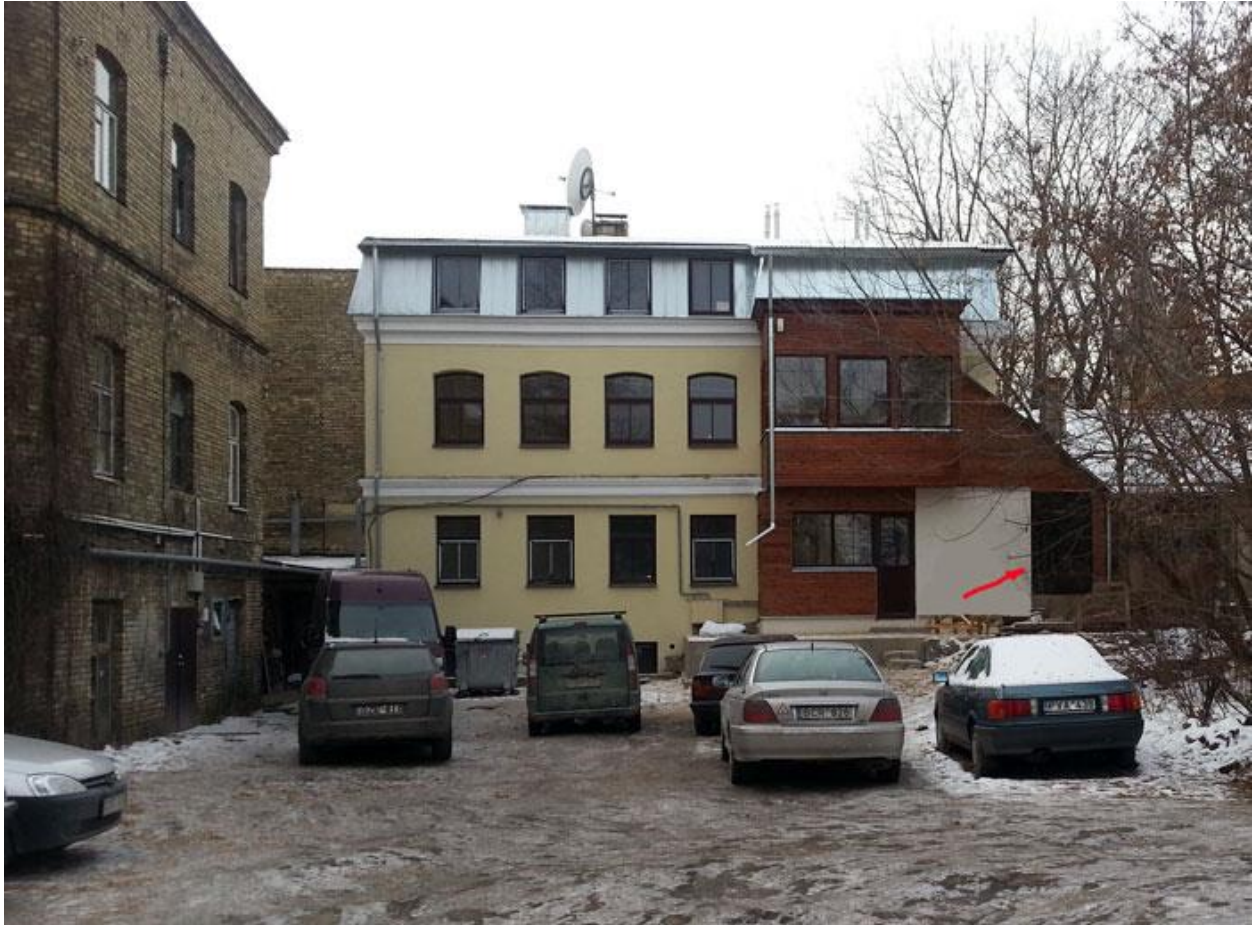
Pastatas, rodyklė rodo jėjimą. Patalpos mansardoje.